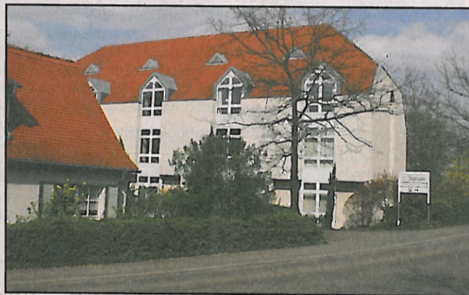
Teilansicht des Gebäudekomplexes Keysermühle.

Allein die größte Baumaßnahme, der Umbau der Zimmer im Westflügel zu modernen Doppel- und Einzelzimmern mit eigenem Bad wird