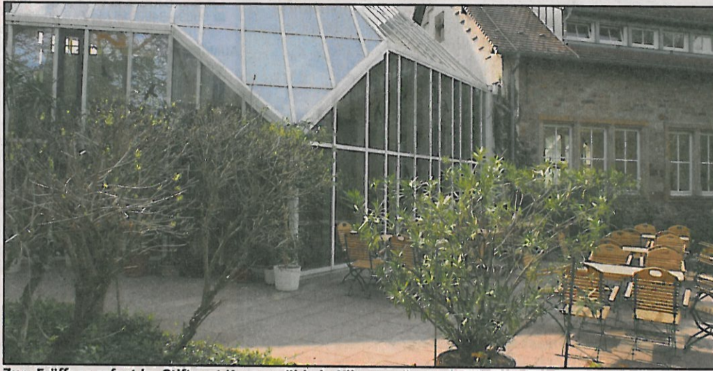
Zum Eröffnungsfest im Stiftsgut Keysermühle in Klingenstein ist die Bevölkerung eingeladen.

Ab 11 Uhr werden alle Gäste, Freunde und Interessierte mit Sekt und kleinen regionalen Probier-