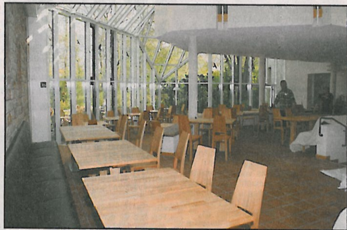
Der Restaurantbereich wird bis zur Eröffnung fertig gestellt sein.

Die meisten Gewerke wurden von lokalen Betrieben durchgeführt. Zur Nachhaltigkeit gehört aber auch die Sozialverträglichkeit. So sollen zehn behinderte Mitarbeiter im Integrationsbetrieb Keysermühle die Chance auf einen regulären Arbeitsplatz bekommen, ge-