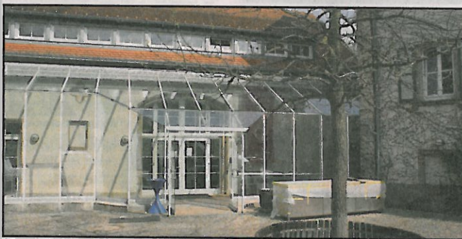
Eingangsbereich vom Stiftsgut Keysermühle.

Weitere Infos www.stiftsgut-keysermuehle.de . (ps/end)